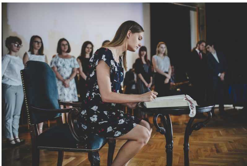
Tradycyjnie najlepsi absolwenci płockich szkół ponadgimnazjalnych wpisali się do Księgi Chwały

Uzdolnieni uczniowie płockich szkół od lat sprawdzają swoją wiedzę w Międzyszkolnej Lidze Przedmiotowej organizowanej przez Szkołę Podstawową z Oddziałami Dwujęzycznymi nr 3 oraz Wydział Edukacji. W XXV edycji ligi dla szkół podstawowych wystartowało 901 uczniów z klas III - VIII z 29 szkół. Trzecioklasiści rywalizowali w kategoriach edukacja polonistyczna i edukacja matematyczna. Uczniowie klas IV w trzech kategoriach: j. polski, j. angielski, matematyka, uczniowie kl. V-VI w czterech: j. polski, j. angielski, matematyka, historia, zaś uczniowie kl. VII - III w trzech: j. polski, j. angielski, matematyka. Ponadto, uczniowie klas III i IV brali udział w konkursie z wykorzystaniem komputera i programu multimedialnego pt. „Łamigłówki logiczno-matematyczne”. Ogółem przeprowadzono 21 konkursów. Uczestnicy startowali zarówno indywidualnie, jak i drużynowo. We wszystkich kategoriach wyłoniono 102 laureatów indywidualnych i 71 drużynowych. Dla uzdolnionych gimnazjalistów odbyła się ostatnia – XV edycja Międzygimnazjalnej Ligi Przedmiotowej. Uczniowie klas III rywalizowali w trzech kategoriach: j. polski, j. angielski i matematyka. Poziom rywalizacji był bardzo wysoki. W konkursach wzięło udział 71 gimnazjalistów z 10 płockich szkół.