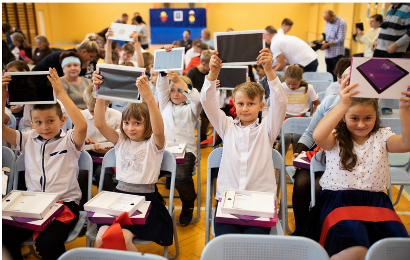
Uczniowie z tabletami zakupionymi w ramach programu "Lekki plecak"

System oświaty obejmuje placówki publiczne i niepubliczne. Jednostki samorządu terytorialnego mogą zakładać i prowadzić tylko szkoły publiczne.