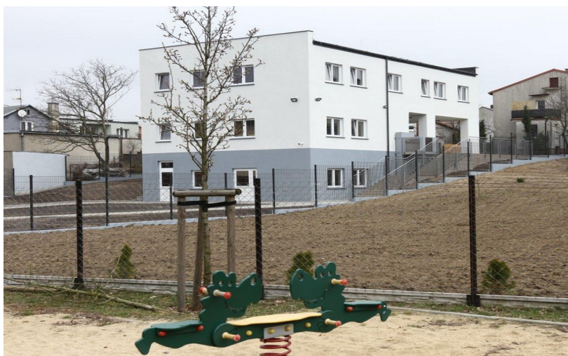
Nowo powstały budynek Placówki Socjalizacyjnej nr 2 przy ul. Południowej 13

Pomoc społeczna skierowana jest do osób zagrożonych różnymi formami wykluczenia społecznego. Ma na celu umożliwienie osobom i rodzinom przezwyciężanie trudnych sytuacji życiowych, których nie są w stanie pokonać, wykorzystując własne uprawnienia, zasoby i możliwości. Miasto Płock finansuje instytucjonalne formy pomocy społecznej, miejskie programy pomocy dla różnych grup osób potrzebujących oraz działania organizacji pozarządowych.