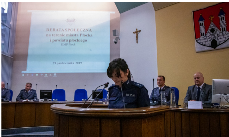
Debata nt. bezpieczeństwa 29 października 2019 r. w Urzędzie Miasta Płocka

Jednym z podstawowych zadań władz miasta jest zapewnienie bezpieczeństwa mieszkańcom oraz innym osobom przebywającym na terenie Płocka. Uchwałą Nr 655/XXXIX/2017 Rady Miasta Płocka z dnia 28 listopada 2017 roku został wprowadzony „Miejski program zapobiegania przestępczości oraz porządku publicznego i bezpieczeństwa mieszkańców Miasta Płocka na lata 2018–2022”, mający na celu wzrost poczucia bezpieczeństwa społeczności lokalnej poprzez ograniczenie liczby przestępstw i wykroczeń szczególnie uciążliwych dla mieszkańców, poprawę bezpieczeństwa w ruchu drogowym, wzrost zaufania do służb i instytucji odpowiedzialnych za bezpieczeństwo i porządek publiczny. Oceny realizacji Programu dokonuje się w cyklu rocznym w ramach sprawozdania z działalności Komisji Bezpieczeństwa i Porządku przedkładanego Radzie Miasta Płocka do 31 stycznia każdego roku. Sprawozdanie z realizacji powyższego Programu za 2019 r. zostało opublikowane w Dzienniku Urzędowym Województwa Mazowieckiego z dnia 12 lutego 2020 r. pod poz. 2058.