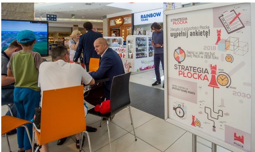
"Strategia zrównoważonego rozwoju miasta Płocka do 2030 roku" powstała w procesie uspołecznionym

Miasto Płock planuje swój rozwój w oparciu o „Strategię zrównoważonego rozwoju miasta”. Aktualnie głównym dokumentem strategicznym miasta jest Uchwała Nr 810/XLIX/2018 Rady Miasta Płocka z dnia 28 czerwca 2018 roku w sprawie przyjęcia Strategii zrównoważonego rozwoju miasta Płocka do 2030 roku. „Strategia” powstała w procesie uspołecznionym z udziałem najważniejszych interesariuszy miasta. Dokument wyznacza kluczowe kierunki rozwoju oraz cele strategiczne miasta i ma nadrzędne znaczenie w stosunku