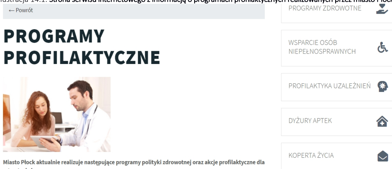
Ilustracja 14.1: Strona serwisu internetowego z informacją o programach profilaktycznych realizowanych przez miasto Płock

Miasto Płock aktualnie realizuje następujące programy polityki zdrowotnej oraz akcje profilaktyczne dla mieszkańców: