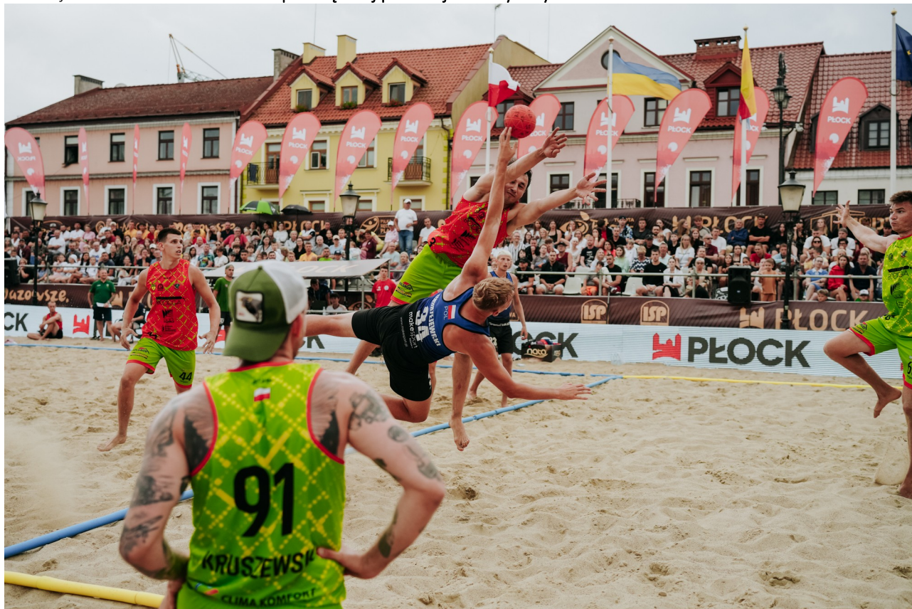
Ilustracja 13.5: Mistrzostwa Polski w piłce ręcznej plażowej na Starym Rynku