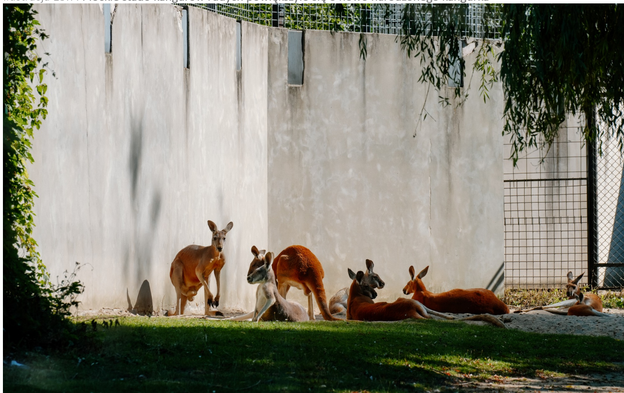
Ilustracja 13.7: Płockie stado kangurów rudych powiększyło się o nowo narodzonego kangurka

Jedną z największych atrakcji turystycznych Płocka jest Miejski Ogród Zoologiczny. Płockie zoo organizuje rozmaite wydarzenia, w których mogą uczestniczyć całe rodziny. Można wśród nich wymienić takie projekty, jak np.: Ferie w zoo, Zoo po zmroku, 95. urodziny aligatorzycy Marty, Wieczór marzeń w zoo, Mistrzostwa Polski i Europy Gupików czy Dzień tapira. Po raz 11. odbyła się także ZONOOOC – nocne biwakowanie wśród dzikich zwierząt. Dla gości przygotowano wiele atrakcji: strefy animacji, gier i zabaw oraz warsztaty plastyczne. Gościem specjalnym wydarzenia był Przemek Kossakowski – dziennikarz, podróżnik, terapeuta. Ogród odnotował także w 2025 r. kolejne narodziny zwierząt – wydarzenie niezwykle ważne, które często ma na celu ochronę zagrożonych gatunków oraz budowanie ich populacji. Na świat przyszły tygrysy syberyjskie, osioł Poitou, kangur rudy, oryks szablrogi, skorpiony leśne, gibbon czapnik, gibbon ungo, lwiątki złote, kozy miniaturowe, owce skudde, kucyk szetlandzki, makaki japońskie i gołąbki diamentowe.