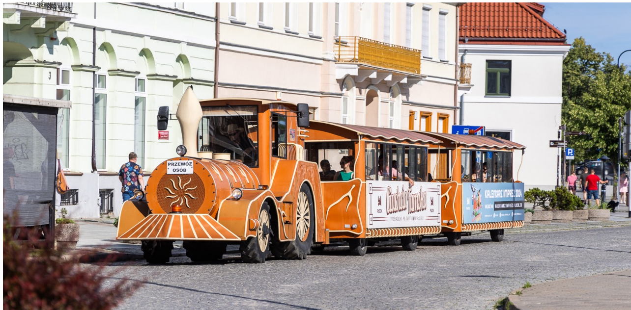
Ilustracja 13.6: Ciuchcia Tumska na ulicach Płocka

Powstał kolejny wielowymiarowy mural, tym razem promujący sportowego ducha Płocka, na ogrodzeniu Stadionu Miejskiego im. Bernarda Szymańskiego od strony ul. Kochanowskiego. Graffiti przedstawia osiem sylwetek zawodników trenujących frisbee, bieg, pchnięcie kulą, skok w dal, piłkę nożną, tenis, tenis na wózku, koszykówkę oraz skok wzwyż. Inspiracją do powstania muralu był m.in. jubileusz 30-lecia Stowarzyszenia Integracyjny Klub Tenisa w Płocku.