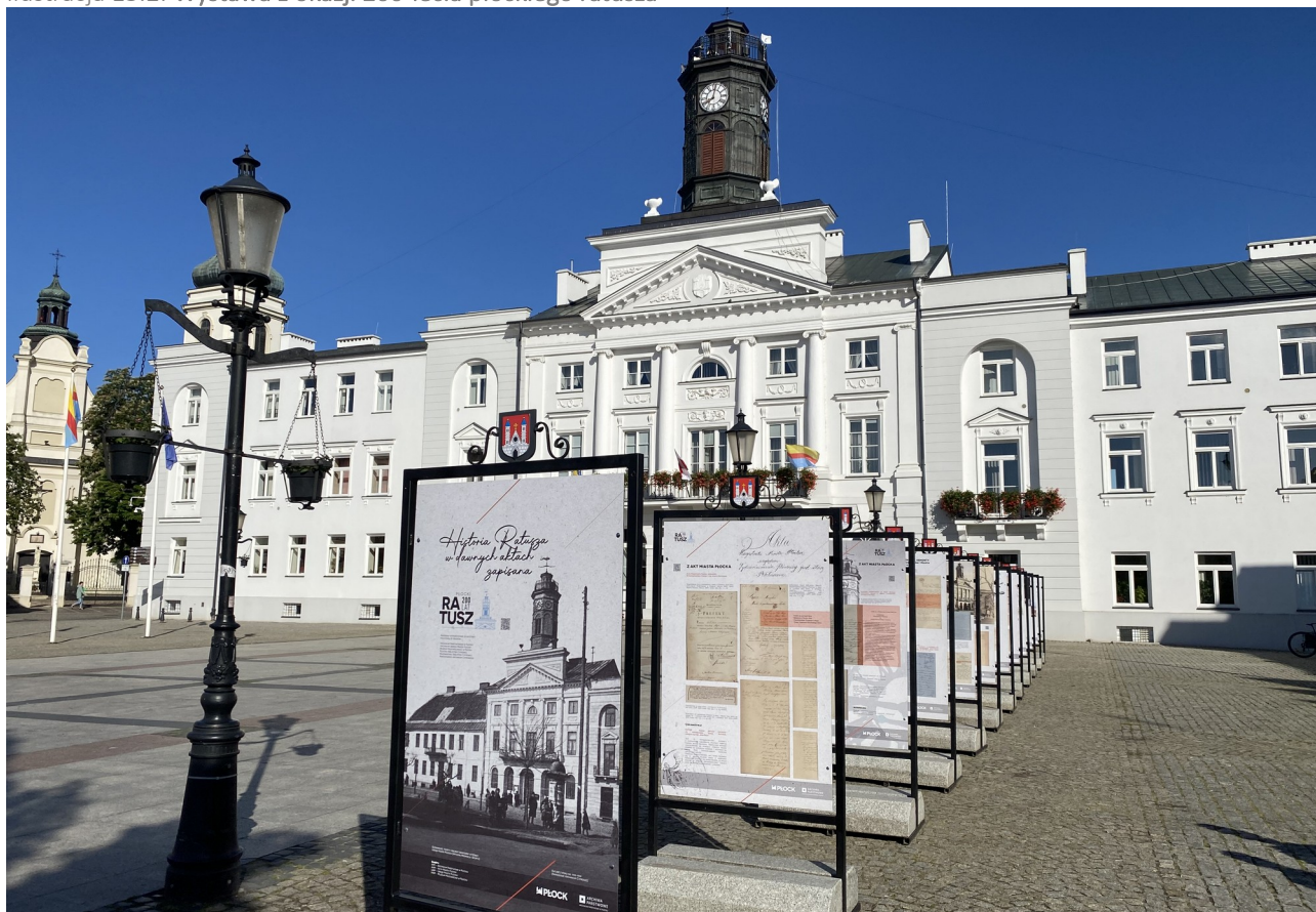
Ilustracja 13.2: Wystawa z okazji 200-lecia płockiego ratusza

➤ Wydano okolicznościowe kalendarze, gadżety promocyjne i stosowano okolicznościowy papier z logo ratusza oraz stopką @, który nadawał wydarzeniu formalny i unikalny charakter.