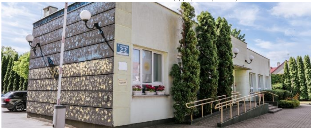
Ilustracja 15.3: Dom dla Matek z Małoletnimi Dziećmi i Kobiet w Ciąży przy ul. Misjonarskiej

domowej musiały opuścić swoje miejsce zamieszkania, tj. umieszczając w Hostelu 10 osób (w tym siedmioro dzieci) oraz w mieszkaniu treningowym 16 osób (w tym ośmioro dzieci). Z pomocy Ośrodka Interwencji Kryzysowej skorzystało 1 476 osób. Ogółem liczba rodzin, którym udzielono pomocy, to 544. Do Ośrodka zgłaszały się rodziny znajdujące się w kryzysie z powodu m.in.: przemocy domowej, przemocy wobec dzieci, problemów związanych z nadużywaniem alkoholu przez członka rodziny, konfliktu rodzinnego i sąsiedzkiego, trudności opiekuńczo-wychowawczych, problemów rodzinnych i małżeńskich, problemów emocjonalnych, kryzysu utraty i żałoby, zaniedbywania osoby starszej, podejrzania zaniedbywania dzieci. Ośrodek Interwencji Kryzysowej wystosował 97 wniosków do Sądu o wgląd w sytuację nieletnich (w tym pięć wniosków o zabezpieczenie dzieci w związku z art. 12a ustawy o przeciwdziałaniu przemocy domowej ) oraz skierował do Prokuratury 14 zawiadomień o popełnieniu przestępstwa znęcania się. Pracownicy Ośrodka Interwencji Kryzysowej i Miejskiego Zespołu Interdyscyplinarnego ds. Przeciwdziałania Przemocy Domowej uczestniczyli w szkoleniach i superwizjach dotyczących problematyki przeciwdziałania przemocy w rodzinie.