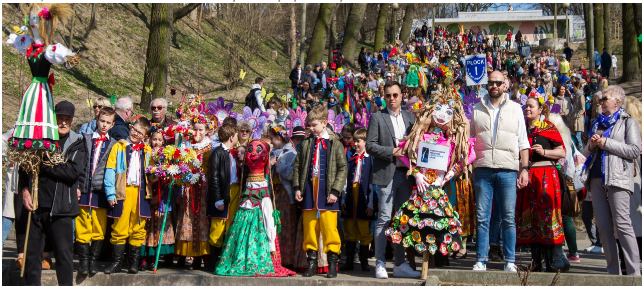
Ilustracja 16.3: Płockiemu Powitaniu Wiosny towarzyszył barwny korowód