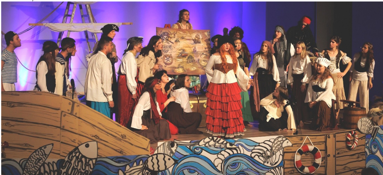
Ilustracja 16.4: Spektakl „Statek Szaleńców” teatru Młodzieżowego Domu Kultury im. Króla Maciusia Pierwszego podczas Senioriady

➤ Miesiąc Seniora, który odbył się w Płocku już po raz czwarty i trwał od 26 września do 25 października. Urząd Miasta wraz z Płocką Radą Seniorów zrealizował 13 wydarzeń o różnorodnej tematyce: porady lekarskie, spacer i rajdy rowerowe, aktywności społeczno-kulturalne. Miesiąc Seniora zainaugurowany został kolorową paradą, a zakończył się Senioriadą – przeglądem twórczości artystycznej seniorów oraz spektaklem pn. „Statek Szaleńców” w wykonaniu teatru Młodzieżowego Domu Kultury im. Króla Maciusia Pierwszego. W wydarzeniu udział wzięły grupy artystyczne seniorów następujących kategoriach: zespoły wokalne, instrumentalne, wokально-instrumentalne, chóry, zespoły taneczne, kabarety, grupy teatralne.