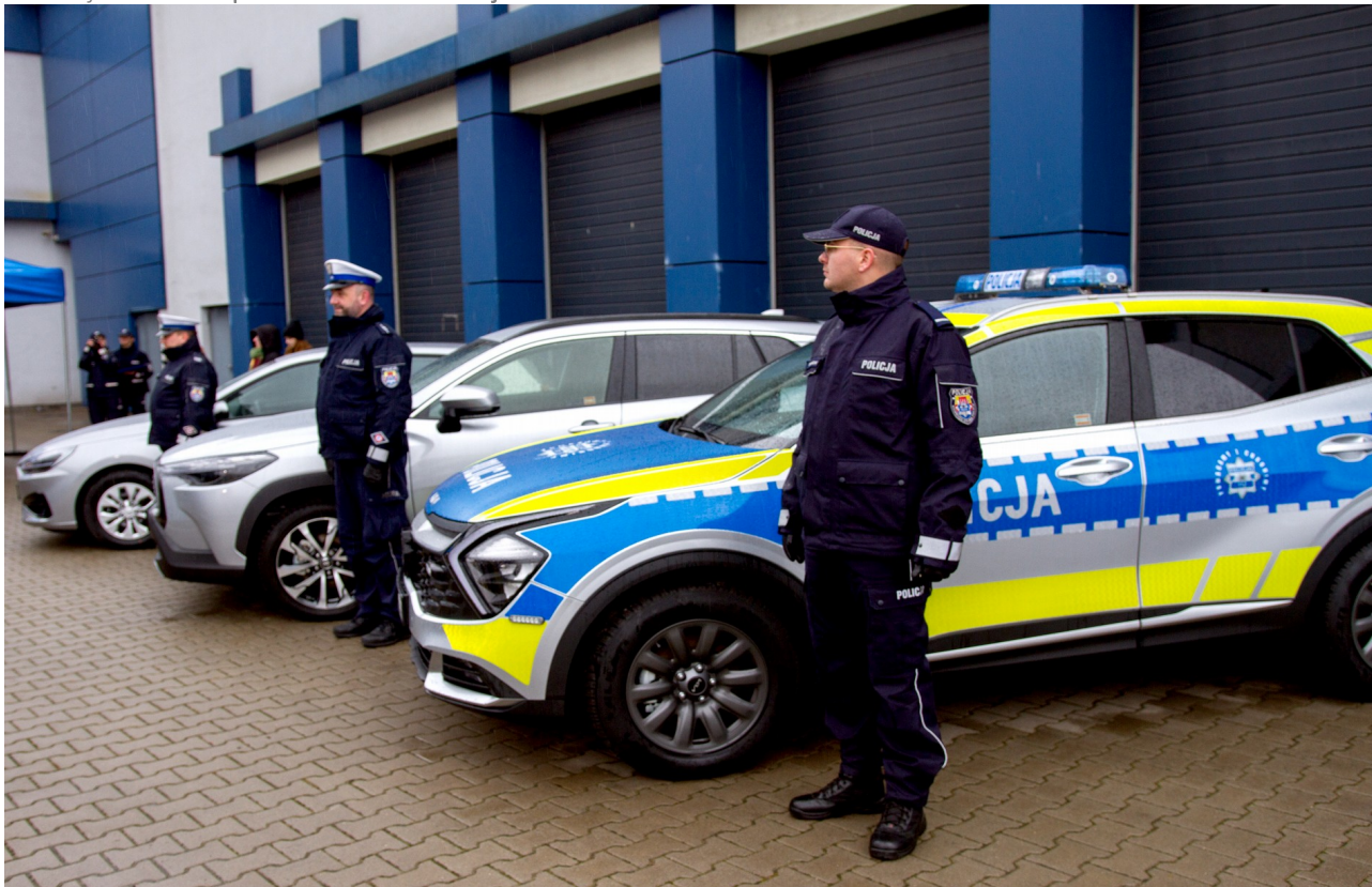
Ilustracja 18.1: Zakup radiowozów dla Policji dofinansowano z budżetu Miasta Płocka