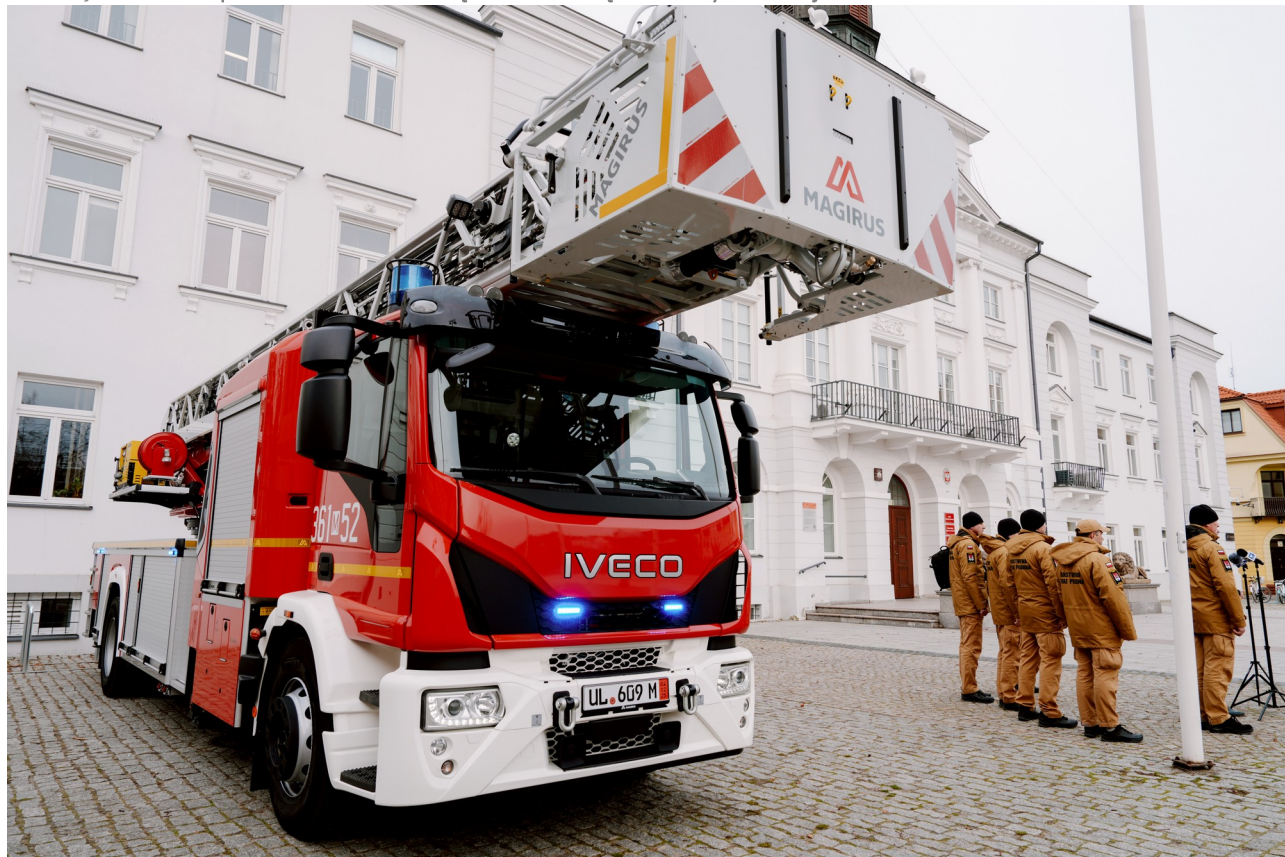
Ilustracja 18.2: Zakup samochodu z drabiną mechaniczną dla Straży Pożarnej dofinansowano z budżetu Miasta Płocka

Komenda Miejska Państwowej Straży Pożarnej w Płocku w 2025 r. odnotowała na terenie Płocka 1,1 tys. zdarzeń, w tym 225 pożarów, 761 miejscowych zagrożeń oraz 58 alarmów fałszywych.