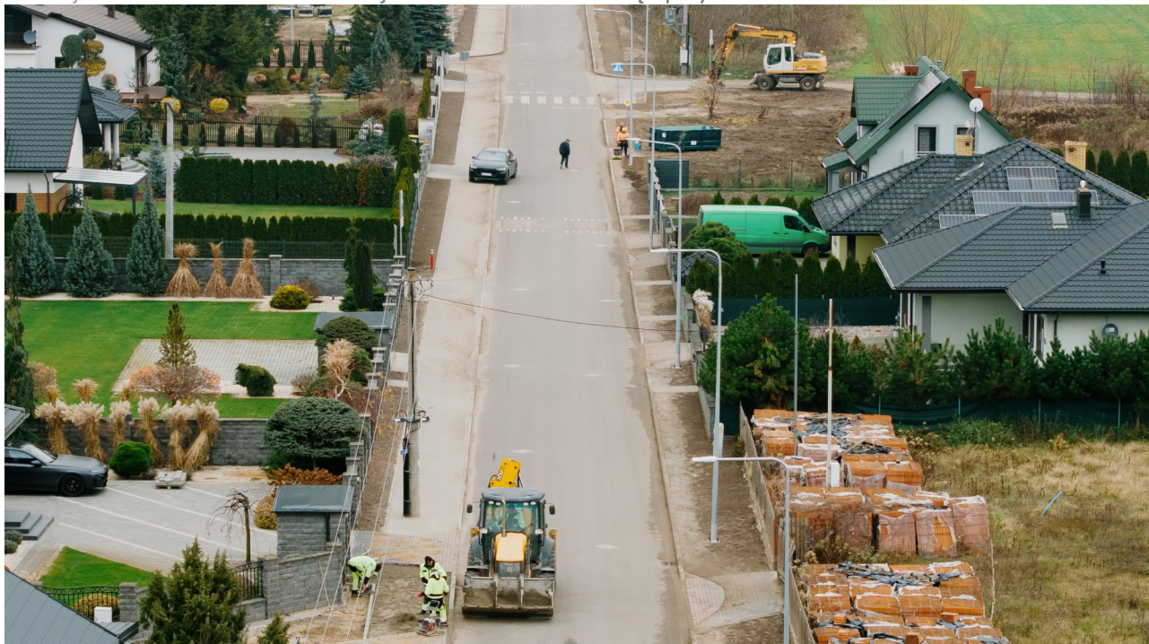
Ilustracja 20.2: Rozbudowa ul. Browarnej na osiedlu Ciechomice dzięki pozyskanemu dofinansowaniu