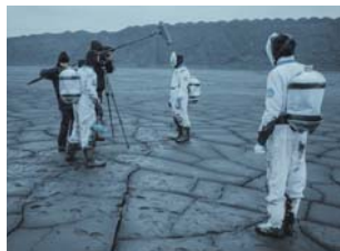
C.D. NA STR. 22

Trzech chłopaków wraz z tatą jednego z nich od ponad 15 lat co roku wyjeżdża wspólnie na wakacje, by nakręcić kolejny horror w niezwykłych plenerach i tajemniczych miejscach Polski.