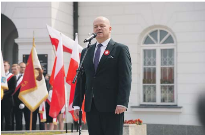
Prezydent Andrzej Nowakowski podczas ubiegłorocznych obchodów Święta Narodowego Trzeciego Maja